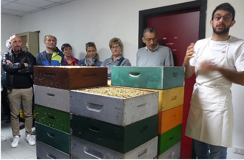
Zu Besuch in der Imkerei Facchinelli in Lavis

Um eine Honig-Vielfalt auf dem heimischen Markt anbieten zu können, stellen die drei Trentiner Imker ihre Bienenstände teilweise in der eigenen Region, aber auch verstreut in ganz Italien auf. Neben den traditionellen Sorten wie Akazien-, Löwenzahn-, Linden-, Wiesen- und Kastanienhonig bereichern auch andere Honigsorten wie Erdbeer-, Orangenblüten-, Karotten- und Zwiebelhonig das Sortiment. Die Gäste aus dem Eisacktal konnten zudem einige nicht ortstypische Honigsorten wie z.B. den Eu-