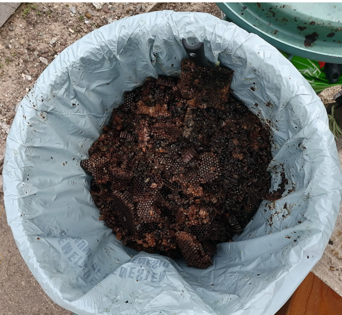
Trestern aus Wachsschmelzer

meist wiederverwendet werden – entweder als Kerzenwachs oder gegen Mittelwände eintauschen. Und die „Überbleibsel“, bzw. Trestern aus den Wachsschmelzern? Auch dieses Material darf nach Einschmelzen nicht für Bienen erreichbar sein. Futterreste, bzw. Krankheitserreger sind auch noch in den Trestern zu finden. Daher sollten diese entsprechend entsorgt werden.