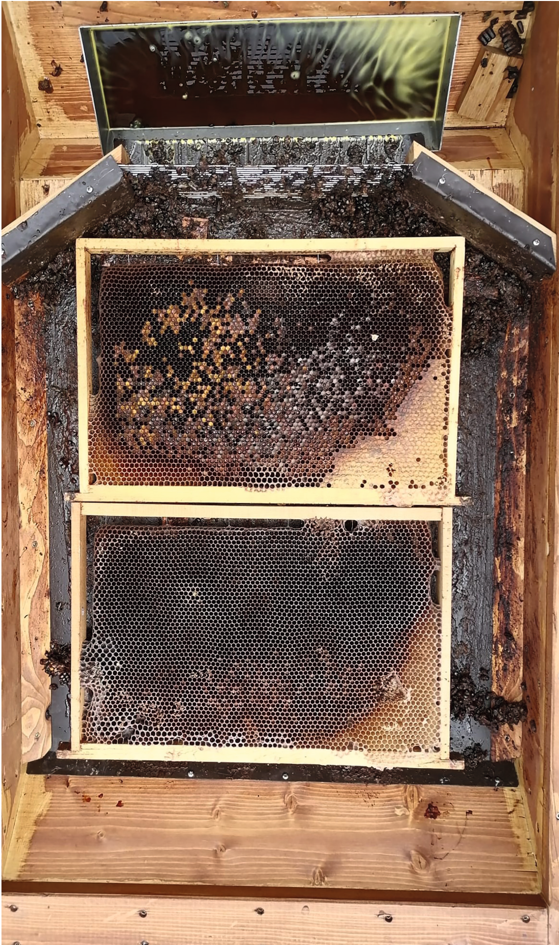
Altwaben im Sonnenwaxschmelzer