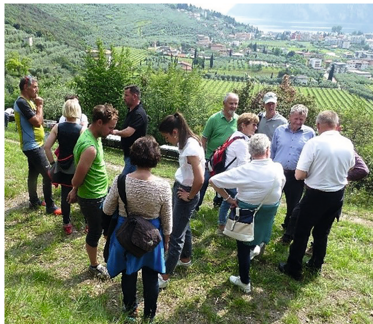
Beim Fachsimpeln in der Nähe von Riva. Im Hinter- grund der Gardasee